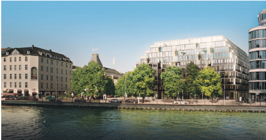
yoo Berlin Außenansicht.

Das Gebiet der Friedrich-Wilhelm-Stadt ist vor allem durch die Charité und drei Theater von Max Reinhardt bekannt. Trotz teilweise starker Zerstörungen während des Zweiten Weltkriegs blieb die Gegend in ihrem Grundriss und ihrer Bebauung größtenteils bis heute unverändert erhalten. Derzeit entstehen hier 87 Wohn- und 3 Gewerbeeinheiten der Luxusklasse.