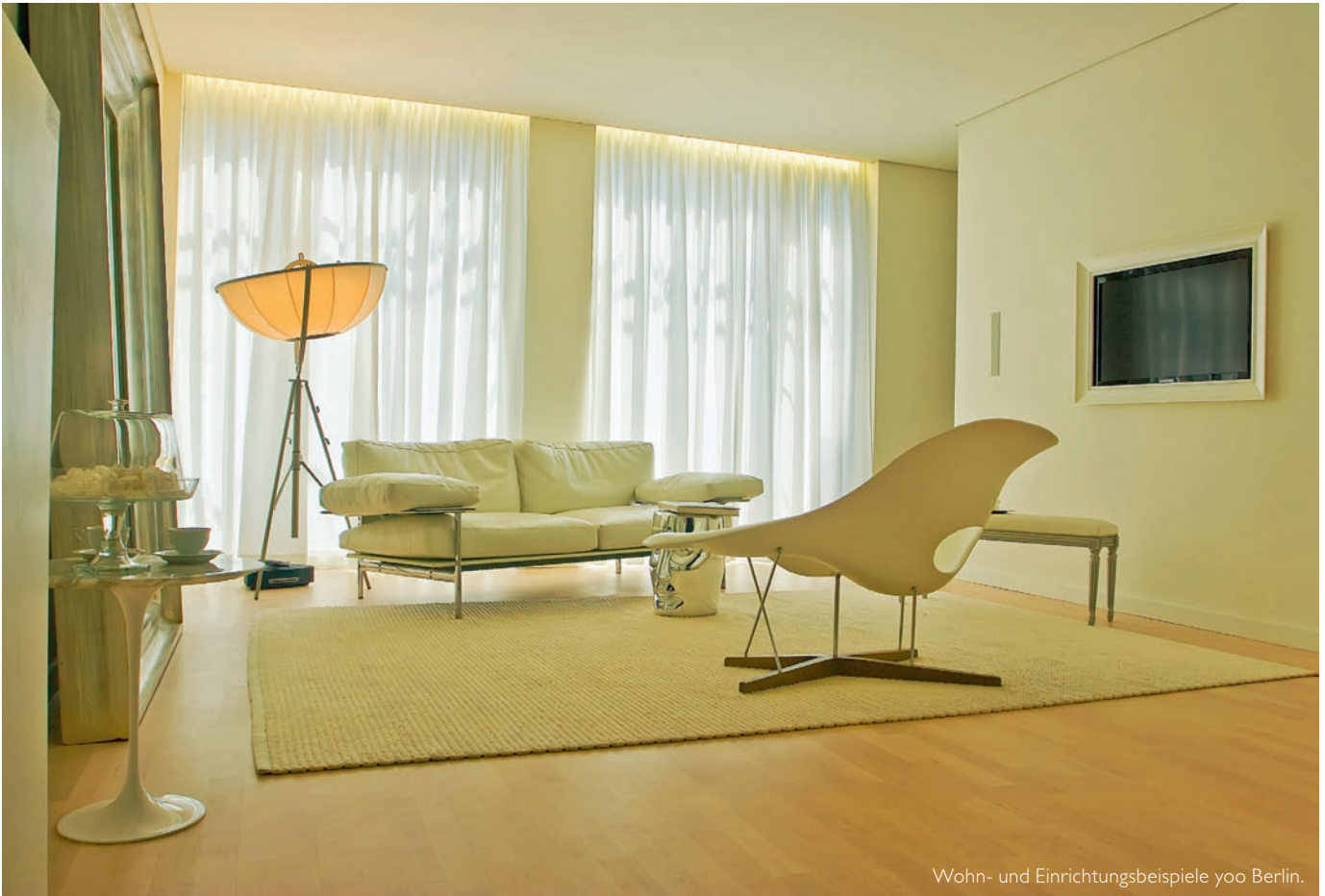
Wohn- und Einrichtungsbeispiele yoo Berlin.